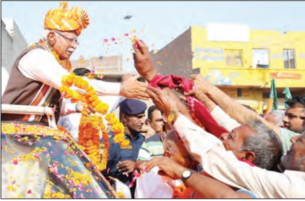
बोलबाला था। हमारी सरकार ने आने के बाद प्रदेश से भ्रष्टाचार का खात्मा किया और ईमानदारी से युवाओं को नौकरी प्रदान की। कांग्रेस के नेता दुनिया में भारत की तौहीन करते फिरते हैं, जबकि देश के प्रधानमंत्री श्री नरेंद्र मोदी ने देश