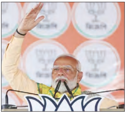
प्रधानमंत्री नरेन्द्र मोदी पश्चिम बंगाल में एक रैली को संबोधित किया।